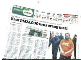
KERATAN Kosmo 8 Oktober 2021.

Mengikut pertuduhan, ketiga-tiga mereka semasa kejadian bertugas di Unit Forensik, Hospital