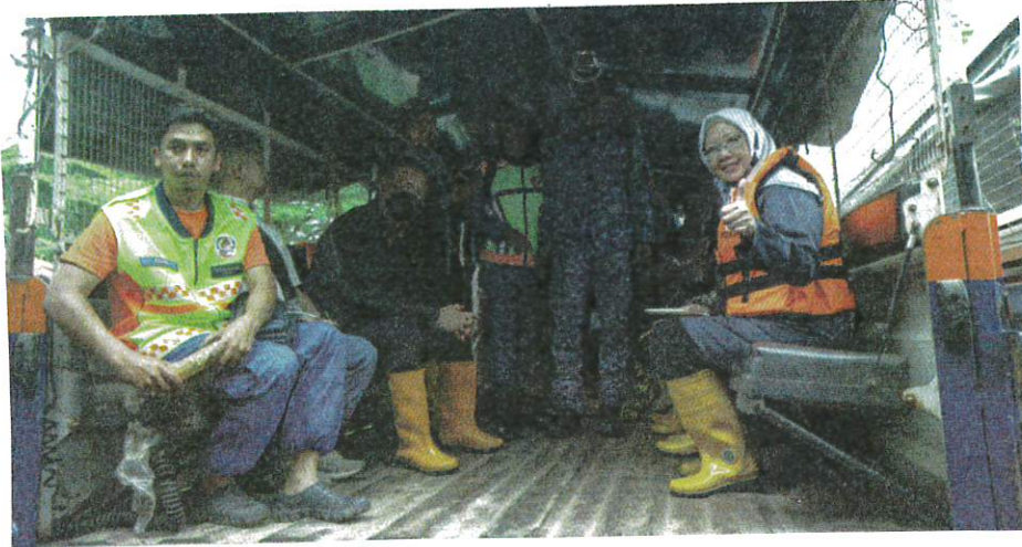
FIRST-HAND LOOK... Health Minister Dr Zaliha Mustafa boards a truck to check the flood situation while visiting the Pasir Mas health office in Kelantan yesterday.