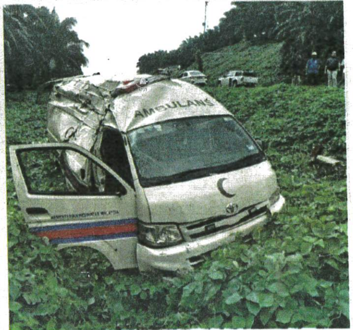
KEADAAN ambulans selepas hilang kawalan dan terbabas ke bahu jalan apabila cuba mengelak sebuah kenderaan pacuan empat roda berhampiran Jambatan Kalumpang, Jalan Semporna-Tawau.

Akibatnya, ambulans terbabas ke tepi jalan menyebabkan dua jururawat masing-masing mengalami kecederaan pada belakang