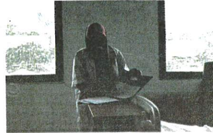
Medical graduates and officers in Malaysia are leaving the country due to lack of posts and no clear training pathways. FILE PIC

beds and healthcare staff, as well as a backlog of follow-up appointments.