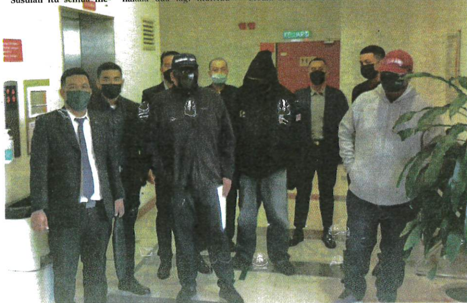
TERTUDUH yang didakwa di Mahkamah Sesyen Shah Alam selepas dikaitkan dengan aktiviti rasuah di bilik mayat hospital

“Tiga individu yang mengaku bersalah dihukum penjara sehari dan denda RM5,000 SPRM”